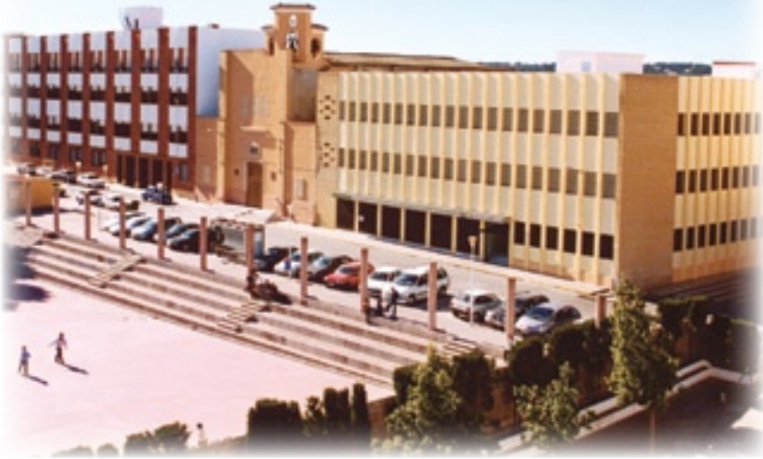
▲ Torrent: Convento de Monte-Sión en la actualidad

–¡Hasta luego!, me responde, mientras se va alejando.