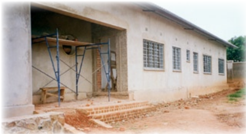
▼ Casa de acogida Luis Amigó. En construcción