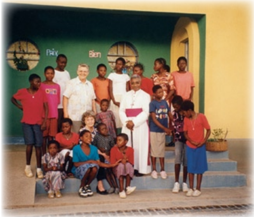
▲ Inauguración de la Casa de Acogida Luis Amigó

La Casa de Acogida Luis Amigó, como muestra el reportaje gráfico adjunto, es una institución sencilla, acogedora, de nueva planta, donde se recogen inicialmente unas 25 niñas de la calle, entre 4 y 16 años. La casa, naturalmente, tiene una mayor capacidad y que fácilmente, y muy pronto, se comprende, resultará insuficiente.