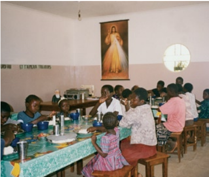
▼ Salón comedor del grupo de acogidos