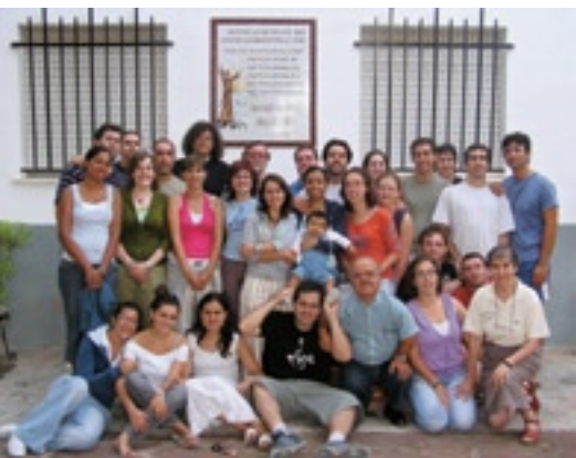
▲ Jóvenes amigionianos