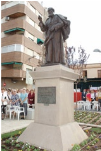
▲ Monumento a Luis Amigó Torrente (Valencia)

el acceso a la capilla, al menos para la gente mayor, no resulta demasiado asequible.