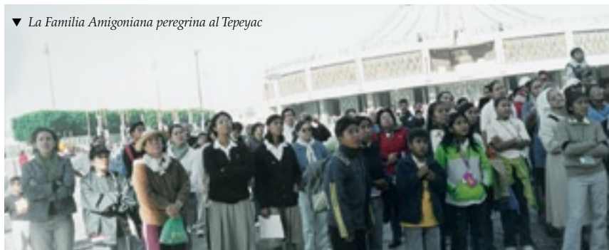
▼ La Familia Amigoniana peregrina al Tepeyac