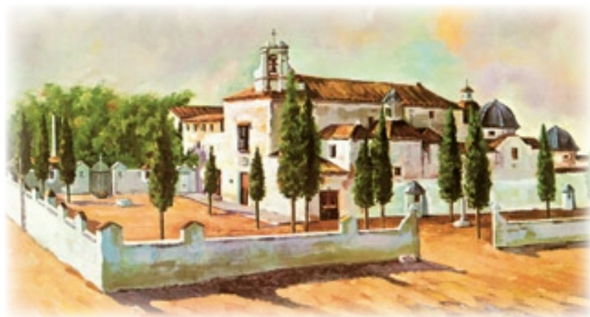
▲ Torrent: Convento Alcantarino de Monte-Sión

Las cumbres y altozanos frecuentemente son lugares de la epifanía o manifestación del Señor. La altura es, con frecuencia, ostensorio, altar y presencia de la divinidad. «A ti levanto mi alma. A ti, que habitas en los montes». Pero es singularmente cierto en Palestina, la patria de Jesús. Allí canta el salmista: «Levanto mis ojos a los montes. ¿De dónde me vendrá el auxilio del Señor?» E Isaías invita al pueblo de Israel: «Venid, subamos al monte del Señor». Y el Señor se manifiesta en el monte santo del Sinaí, en el Oreb, en el Hermón o en el Carmelo. Pero muestra una especial predilección por manifestarse en Jerusalén, en esa trinidad orográfica integrada por el Monte Moria, el Monte Ofel y Monte Sión, sobre los que se levanta la Jerusalén arcaica, primitiva, eterna.