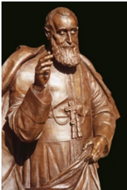
▲ Venerable P. Luis Amigó y Ferrer

que la campanita conventual llama a los parroquianos a la primera misa, o misa de la aurora. Las gentes del pueblo van acudiendo al convento. En la plazuela de la iglesia un religioso pasea embozado todavía en sus hábitos conventuales. Entablo con él amable conversación.