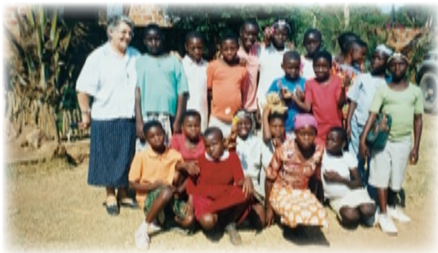
▲ Casa Luis Amigó. Grupo de acogidos

El comúnmente conocido por Congo Belga, a raíz de su independencia en 1960, pasa a denominarse Zaire. Y en la actualidad se le conoce como República Democrática del Congo. Tiene una superficie cercana a los 2.400.000 km 2 . Y una población que raya los cincuenta millones de habitantes, de los que algo más de la mitad es oficialmente católica. El país posee una economía muy pobre.