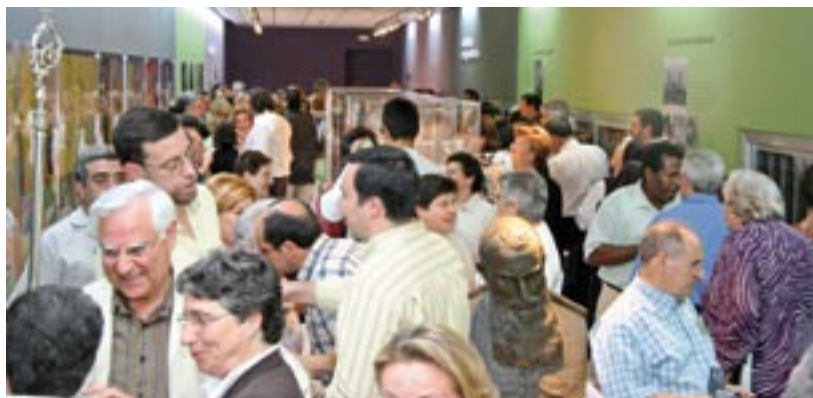
En el museo P. Luis Amigó ▼