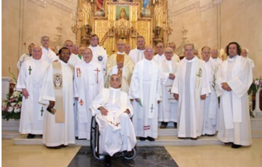
Sacerdotes concelebrantes ▲

del Seminario, y acompañados por 25 sacerdotes, en su casi totalidad amigonianos, presidieron la celebración eucarística.