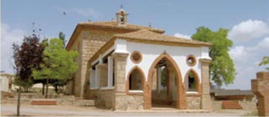
Celadas (Teruel). Ermita de Santa Quiteria ▲

C eladas es un pueblo de Teruel, de unos quinientos habitantes, de cuya ciudad dista 18 kilómetros. La última semana de mayo ha celebrado sus fiestas mayores a Santo Domingo de Silos, patrono del pueblo, a la Virgen de la Salud, y al beato Crescencio García Pobo, hijo ilustre de Celadas y mártir amigoniano.