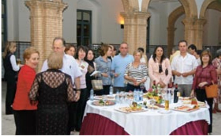
Lunch en el claustro del Seminario ▲