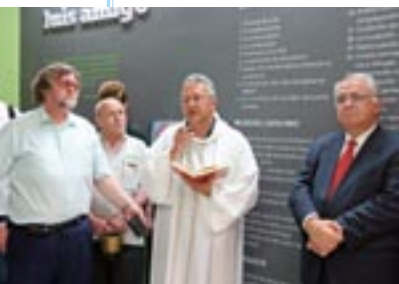
▲ Bendición del museo P. Luis Amigó

A continuación pasa a presentar el Museo Padre Luis Amigó, distribuido en tres partes o secciones: Vida y obra de Luis Amigó; Mártires de la Familia Amigoniana; y, finalmente, labor educativa y pedagógica de la Familia Amigoniana.