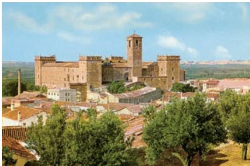
Real Monasterio del Puig. Panorámica ▲