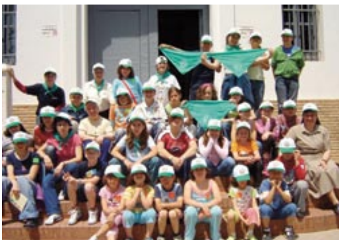
◀ Grupo de zagales

Finalmente pone de relieve las virtudes domésticas del amor mutuo, de la fidelidad prometida, del abrazarse con las cruces propias del estado matrimonial y del pro-