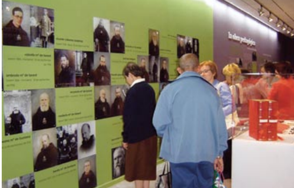
En el museo P. Luis Amigó ▲

curar ser unos buenos padres para vuestros hijos, que son una bendición de Dios.