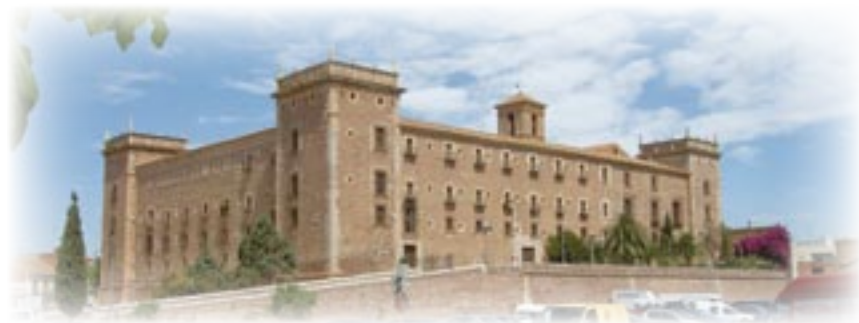
▲ Real Monasterio del Puig de Nuestra Señora

–Hacia las dos de la tarde tendremos comida de sobaquillo, como se dice por estas tierras. Será en los claustros y alrededores del monasterio, le aseguro. Hasta la hora de la comida mi persona todavía dispone del tiempo suficiente para internarse en el patio de armas, pasear por los amplios claustros circundantes y admirar las bellezas del Real Monasterio.