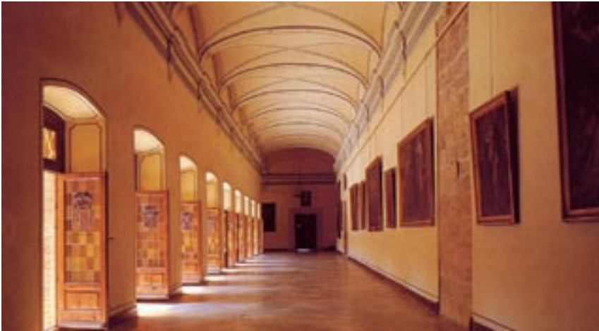
Claustro alto del Monasterio ▲

y en el canto del Te Deum de Eslava. Con el solemne trisagio de la tarde, y la bendición con el Santísimo, concluye esta segunda peregrinación al Real Monasterio de Nuestra Señora de los Ángeles del Puig.