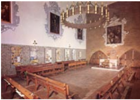
▲ Capilla de los monjes

En esta tercera peregrinación nos reunimos hasta siete mil terciarios capuchinos. Entre seculares y regulares, y de ambos sexos, se entiende. No quisiera exagerar, pero eso dicen las crónicas de la época. Y en ella toman ya parte algunos de los religiosos de la cartuja de Ara Christi del Puig. Cada una de las trece órdenes participantes en la peregrinación lleva, a más de su propio estandarte y su música propia, su coro de voces escogidas.