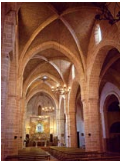
Iglesia del Real Monasterio ▲

Todavía dispongo del tiempo suficiente para acercarme al salón del reino, ubicado en el torreón de sureste, y reservado a los monarcas en sus frecuentes visitas a la Ciudad del Turia. Desciendo al patio de armas en el que puedo admirar los grandes ventanales o balconadas abiertas en los muros y adornados por los escudos nobiliarios de las