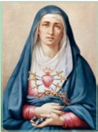
▲ Dolorosa amigoniiana y de Quito

el cuadro un verso del Stabat Mater Dolorosa , que en aquel tiempo solía cambiarse por otro del mismo himno a gusto del mandante.