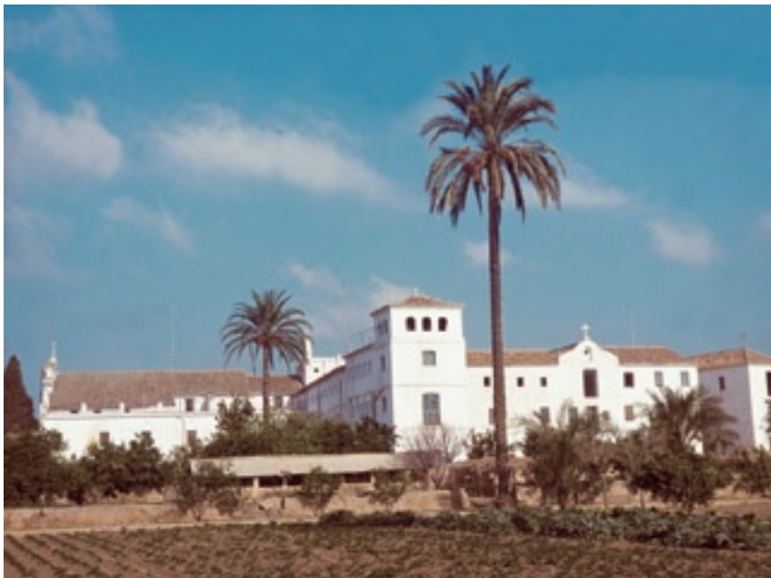
▲ Vista del convento de la Magdalena

Conversando de esta manera cruzamos las últimas calles de Masamagrell y enfilamos el caminillo, ya asfaltado, que desde el pueblo conduce al convento. El padre guardián me va diciendo que tienen el agua necesaria para el riego de la huerta y demás usos domésticos, pues ya Felipe III concede a los frailes poder tomar de la acequia de Moncada, que cruza el huerto conventual, el agua que quisieran.