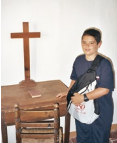
En la celda de Luis Amigó ▲