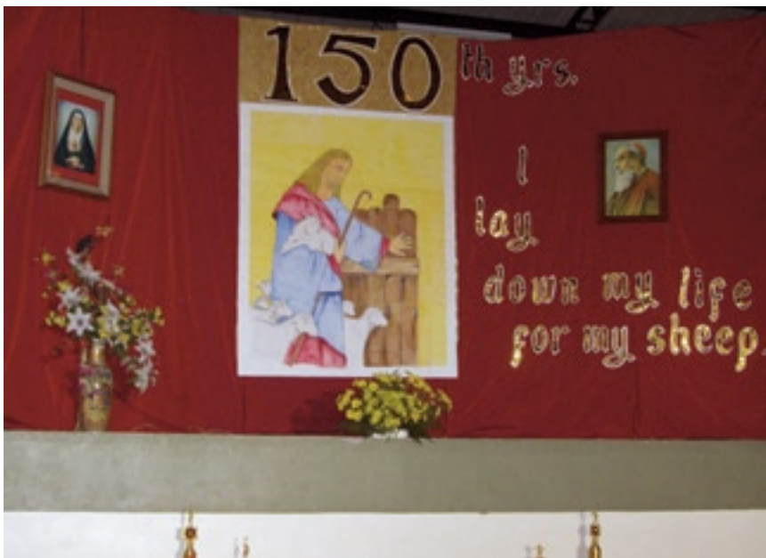
Cartel del centenario ▼

Ocupó el acto central de la clausura del año centenario la celebración de la eucaristía. Fue una liturgia viva, participativa y comunitaria tenida en el magnífico pabellón deportivo del centro. A continuación de la misma se disputó la final de baloncesto y balonvolea, concluyendo los actos matinales con una comida fraterna.