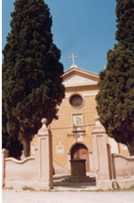
Fachada de la iglesia del convento ▲

Paseo la mirada por los diversos altares simétricamente distribuidos por las naves menores del templo conventual. Veo que hay uno dedicado a San Francisco de Asís, otro a la Inmaculada Concepción y un tercero a la Divina Pastora. También tiene otros altares, dedicados a las Tres Ave-