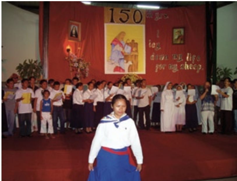
▲ En la sesión de clausura del Año Centenario

El acto cultural de la tarde dio comienzo a las 16'30. El motivo, elegantemente diseñado y colocado en el frontis del pabellón deportivo, decía así: "Doy mi vida por mis ovejas". La función vespertina se articuló en tres actos, teniendo como núcleo central la representación de Luis Amigó joven, Luis Amigó fundador y Luis Amigó obispo.