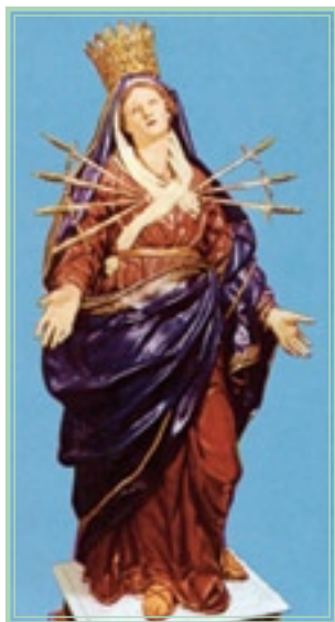
▲ Dolorosa de Monte Senario