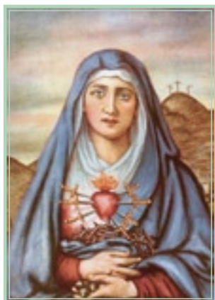
▲ Virgen de los Dolores. Siglo XIX

E n Ecuador se está celebrando el primer centenario del milagro, obrado en un cuadro de la Virgen de los Dolores, en el colegio jesuita de San Gabriel de Quito. El año jubilar culminará el próximo 20 de abril del presente año 2006, cuando se cumplen los cien primeros años del prodigioso evento.