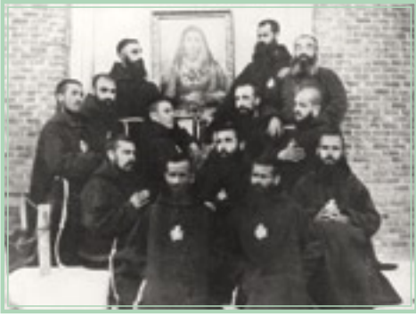
▲ Dolorosa de 1890, amigoniiana