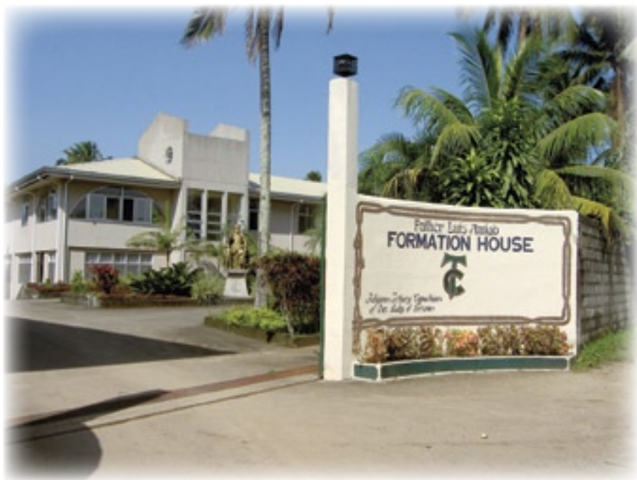
▲ Padre Luis Amigó. Centro de Formación

Con ocasión del 150 aniversario del nacimiento del Venerable Luis Amigó también en Filipinas se ha celebrado, con entusiasmo y el natural colorido popular de aquellas islas, un año amigoniano. El día 17 de cada mes, durante el año jubilar 2004-2005, en la Fraternidad Luis Amigó ha tenido lugar una representación artística sobre la vida, ministerio apostólico y carisma de Luis Amigó. Especialmente interesante resultó la interpretación que realizaron los religiosos del centro sobre el Padre Luis Amigó y la Eucaristía.