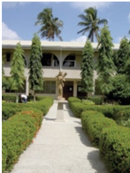
Casa de Formación. Claustro interior ▲

Avanzada ya la tarde, y mientras los diversos grupos se van retirando a sus respectivos barrios, o barangays, todavía sigue la fiesta. Sin duda una bella fiesta en honor del Venerable Luis Amigó en torno a su vida, su obra y su carisma. Indiscutiblemente él bendice desde lo alto una fraternidad que se honra con su nombre y a sus hijos que tanto amor le profesan y tanto honor le tributan.