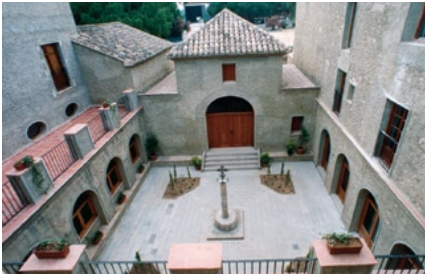
▲ Ermita de Dominga Torres

marías y a San Juan de Ribera, todos los cuales recogen la espiritualidad y piadosas devociones de la rama franciscano capuchina.