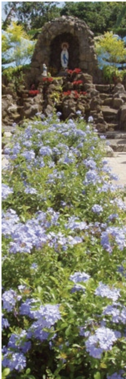
▲ Rincón mariano