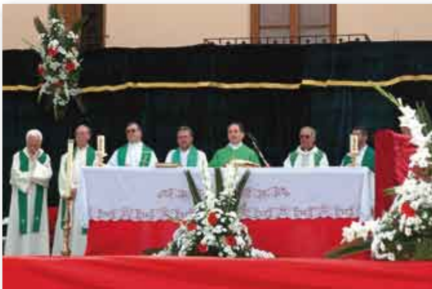
► Grupo central de sacerdotes concelebrantes.

Los actos concluyen con un vino español en los locales del colegio de Nuestra Señora de Monte Sión de Torrente, ofrecido por los padres amigonianos. Los actos han sido sencillos, gozosos, y muy bien organizados. Ofrecieron la oportunidad de que las autoridades, pueblo de Torrente y religiosos del Convento confraternizaran, como ha sido siempre tradicional durante los 115 años que los frailes amigonianos vienen ocupando el antiguo Convent Alcantarino ❀