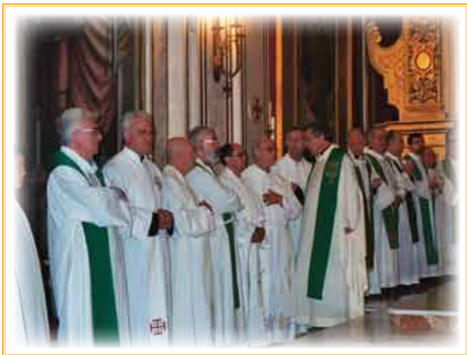
► Grupo de sacerdotes concelebrantes.

Preside la eucaristía el señor Arzobispo de Valencia, Mons. Agustín García-Gasco, con quien concelebra medio centenar de sacerdotes. En la iglesia no cabe un alfiler, ya que acuden unos quinientos asistentes, en su mayoría jóvenes, provenientes de toda España, Europa, e incluso América, como se ha dicho. Es una delicia ver a los más jovencitos, llamados Zagales , sentados en el suelo junto al presbiterio, ataviados con sus camisetas deportivas preparadas para el acto, no perder detalle de la celebración litúrgica. Tal es la asistencia de fieles que muchos de ellos tienen que seguir la celebración eucarística desde la misma plaza de la iglesia.