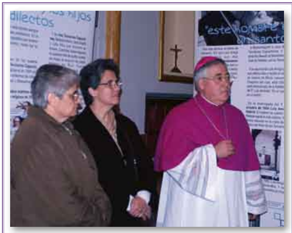
► Inauguración de la "Exposición Luis Amigó".

las autoridades y de los participantes en el entrañable acto organizado en Segorbe con motivo de los 150 años del nacimiento del Obispo Amigó.