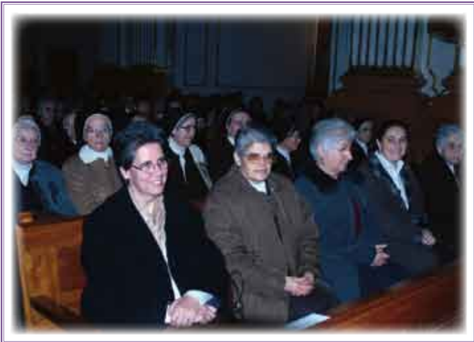
► Grupo de Hnas. Terciarias Capuchinas. Santa Misa.