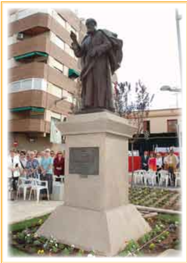
► Otra perspectiva del monumento.