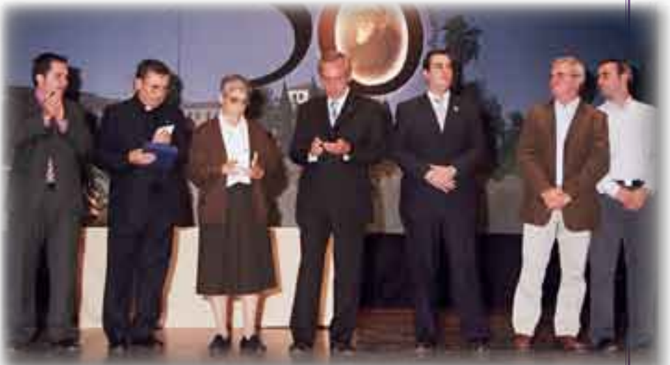
► La Corporación Municipal en la entrega de los galardones concedidos.

Cierra la celebración un concierto de la coral Studium Vocale , que ofrece un bello repertorio, al que sirve de digno colofón el estreno del Himno al Pare Lluís de Massamagrell .