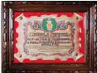
► Pergamino acreditativo.