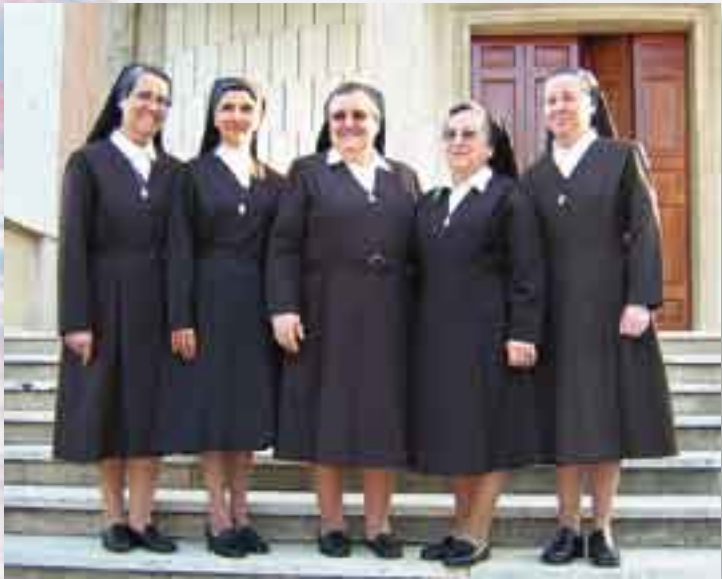
► Nueva Superiora General y Consejo.