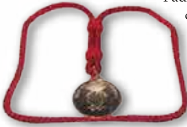
► Medalla de oro otorgada.