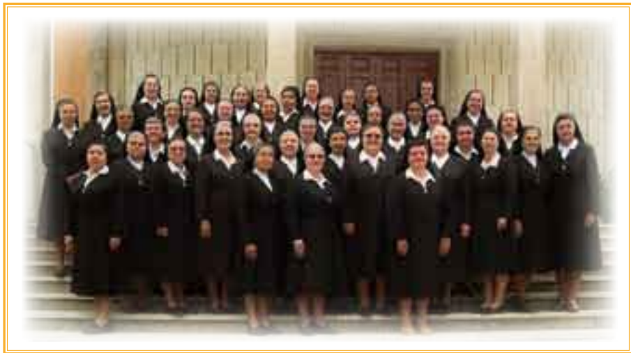
► Hermanas Capitulares.