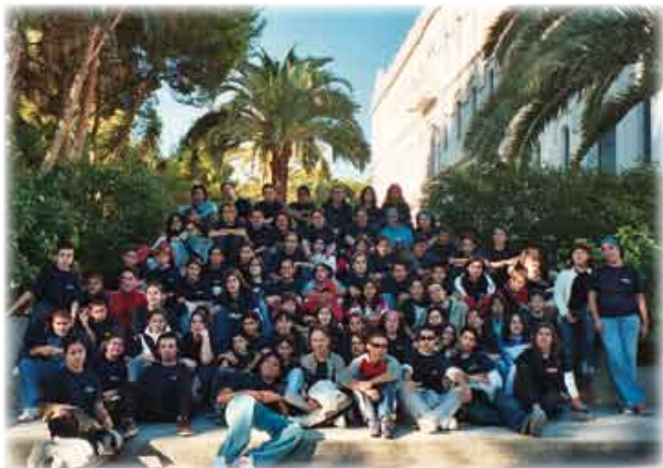
► Grupo de zagales asistentes a los actos.

convento de la Magdalena, así como también el sepulcro de Luis Amigó, la casa y la pila bautismal en Masamagrell, y el centro de misión específica Colonia San Vicente Ferrer, en Burjassot, lugares todos ellos de la provincia de Valencia.