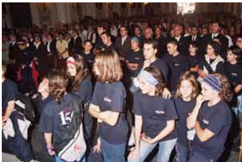
► Asistentes a la misa de acción de gracias.