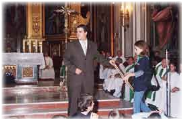
► El Sr. Alcalde obsequia a diversas corporaciones.

El Señor Arzobispo en su homilía, con motivo de iniciarse en esos momentos el Año Eucarístico proclamado por Su Santidad Juan Pablo II, partiendo de la eucaristía, y con alusiones frecuentes a Luis Amigó, ilumina los temas del amor conyugal, el divorcio, el aborto, etc., tan presentes y reiterativos y de tan perenne actualidad.