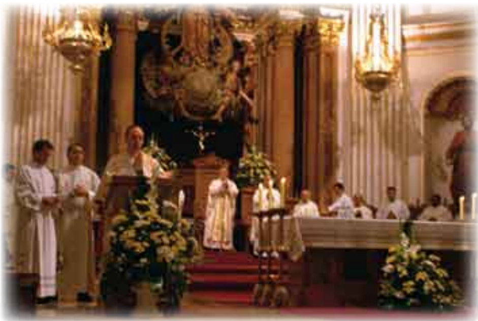
► Misa pontifical en la catedral de Segorbe (Castellón).