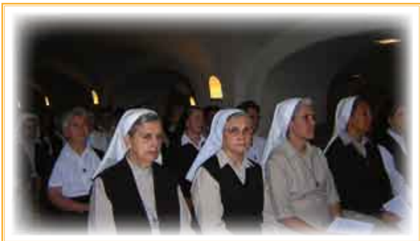
► Eucaristía en la cripta de San Pedro del Vaticano.

“1º Me es grato saludaros con afecto -escribe Su Santidad el Papa- con ocasión del XX Capítulo General, que se celebra en coincidencia con el 150º aniversario del nacimiento de vuestro Fundador, el Venerable Mons. Luis Amigó y Ferrer. Son dos acontecimientos significativos que os ofrecen la oportunidad de dar nuevo vigor a la experiencia espiritual del propio carisma e impulsar vuestra misión evangelizadora característica.