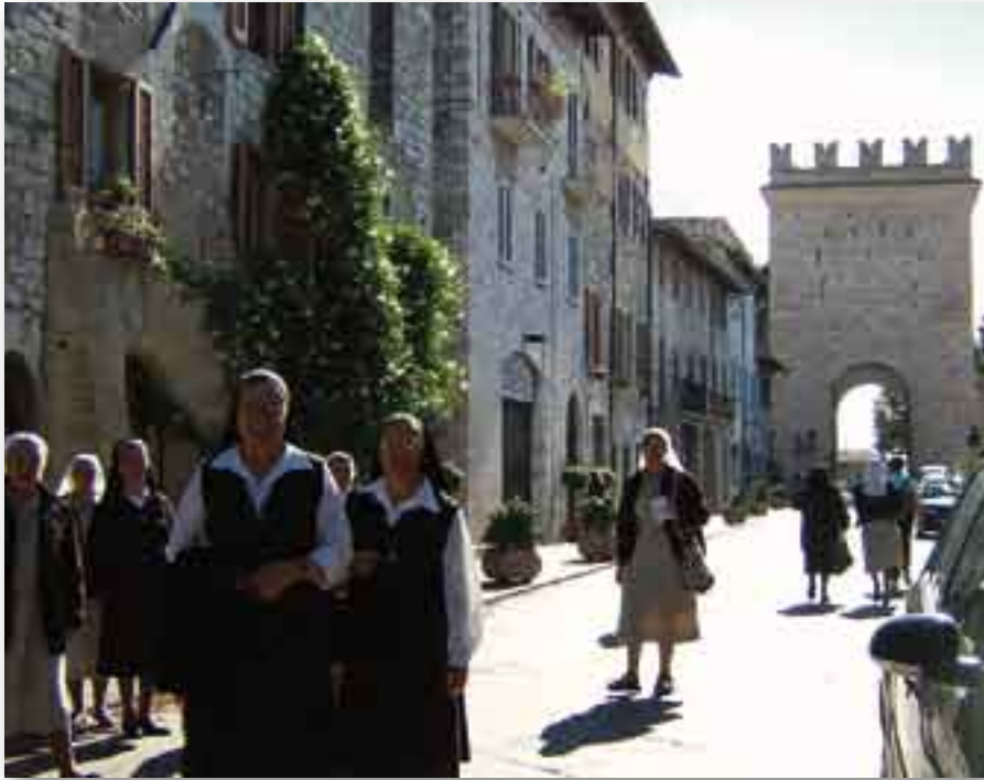
► De visita por las calles de Asís

Durante los días del Capítulo General las Hermanas tuvieron asimismo la facilidad de visitar los lugares franciscanos de Asís y del Monte Alvernia, centros de espiritualidad para todos y cada uno de los integrantes de la gran familia franciscana.