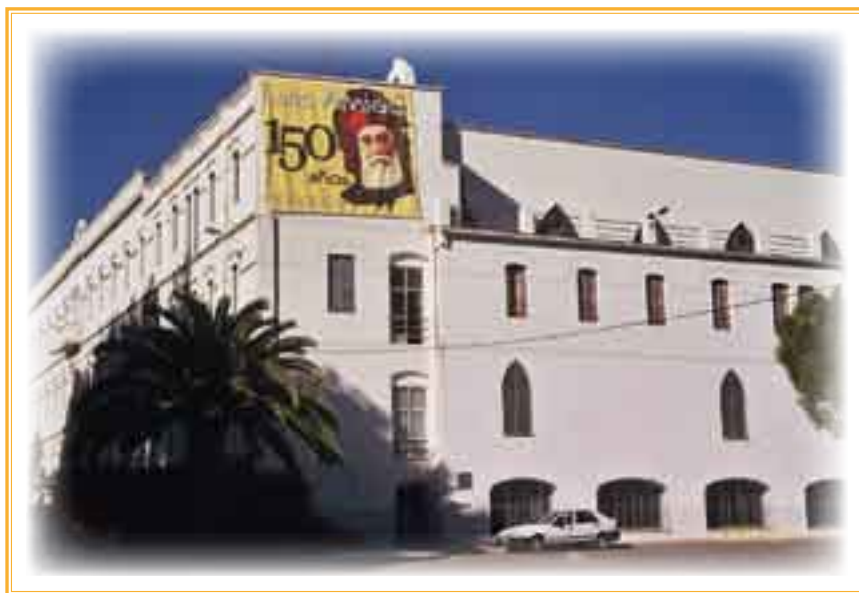
► Seminario San José, de Godella, y logotipo.

Durante el festivo weekend, del 15 al 17, de octubre aprovechan también para conocer diversos lugares amigonianos. No ha faltado su obligada visita al Museo Luis Amigó y al Museo de los Mártires, en Godella, el