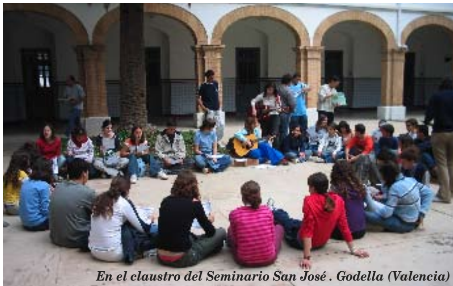
En el claustro del Seminario San José . Godella (Valencia)