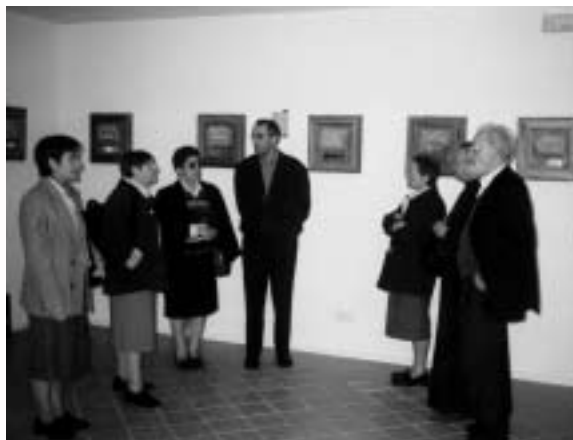
En el salón museo Luis Amigó

Así pues, con ocasión de celebrarse el 125 aniversario de la reapertura del convento, y ser el Venerable Luis Amigó uno de sus fundadores, los padres capuchinos han restaurado esta mansión de paz. Hoy el convento luce blanco y bello como nunca, especialmente en su acogedora iglesia monacal.