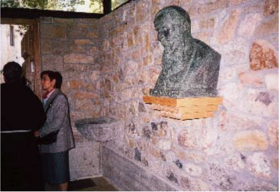
▲ Busto de Luis Amigó, obra de Pablo Serrano