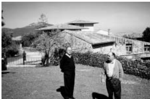
Convento de Montehano (Cantabria). Parte posterior del convento

-como en la trainera del Ángelus de don Pío Baroja- ocupaban el ambón del altar. Presidía la concelebración de la eucaristía el padre Aurelio Laita, vicario general de la orden capuchina, rodeado de capuchinos y terciarios capuchinos, y acompañado de