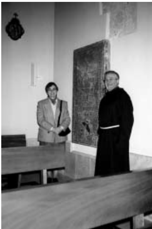
Ante la lápida sepulcral de Bárbara Blombergh

Un aperitivo en la sala museo- y la posterior comida fraterna, amablemente servida por los religiosos del convento- puso fin a una deliciosa jornada que constituyó todo un placer para el espíritu y una delicia de sencillez y fraternidad franciscanas.