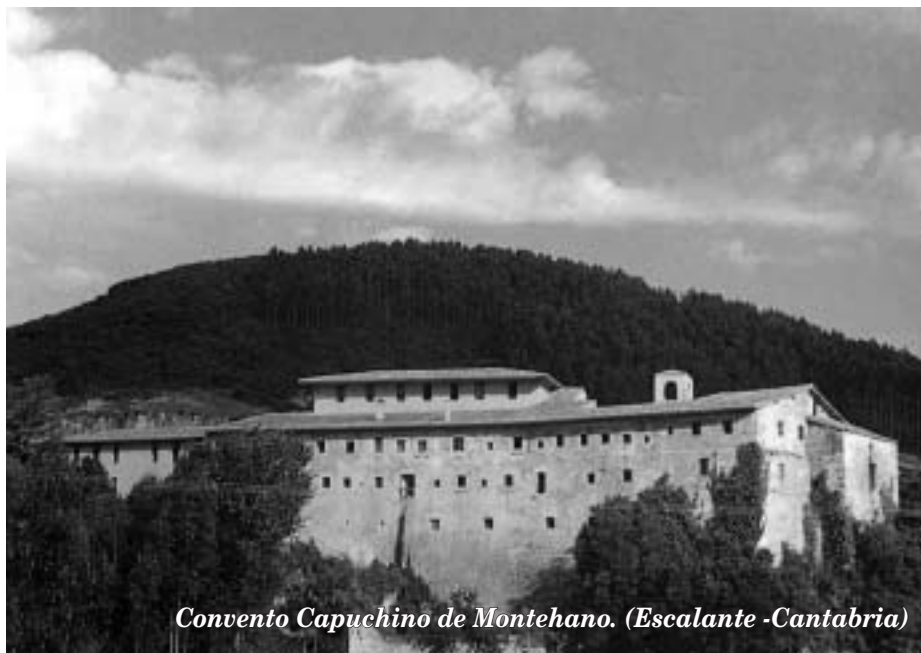
Convento Capuchino de Montehano. (Escalante -Cantabria)