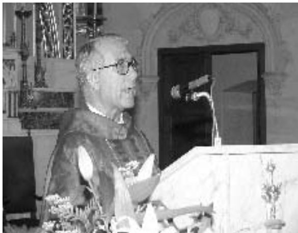
El Rmo. P. General pronunciando la homilía.

dotes, como indica la adjunta información gráfica. Toma parte en la celebración un número elevado de religiosos y religiosas terciarios capuchinos, miembros de la familia franciscana y de otras congregaciones religiosas, y una muy numerosa representación de familiares de los mártires, conocidos y amigos.