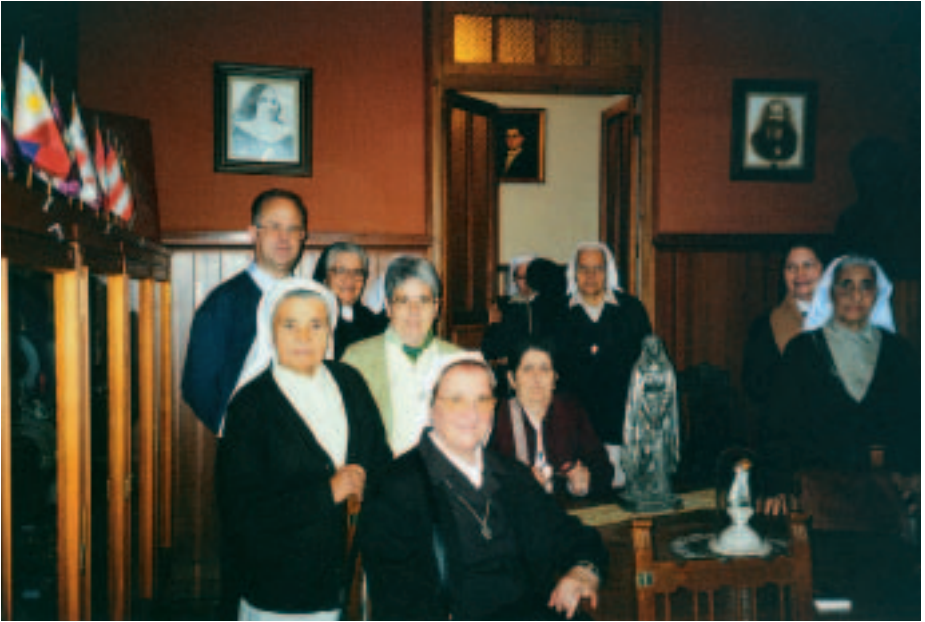
En visita al Museo Luis Amigó de Godella, Valencia. s En peregrinación a los Santuarios Franciscanos del Valle de Rieti. t