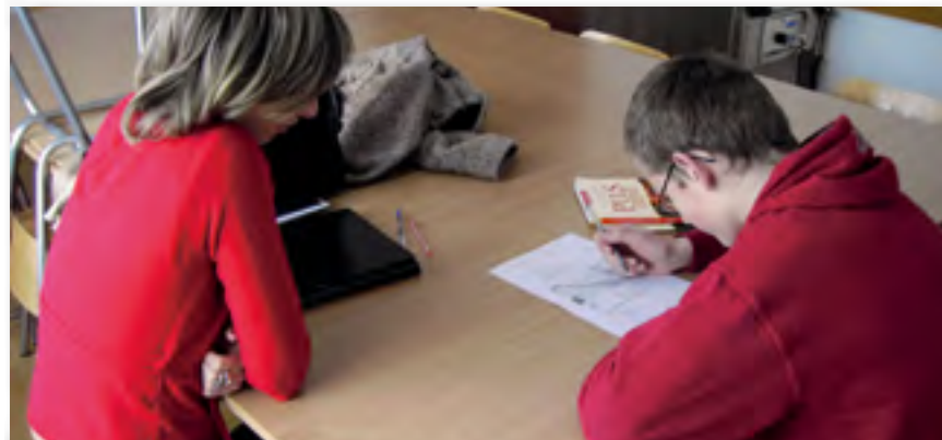
Enseñanza personalizada ▲