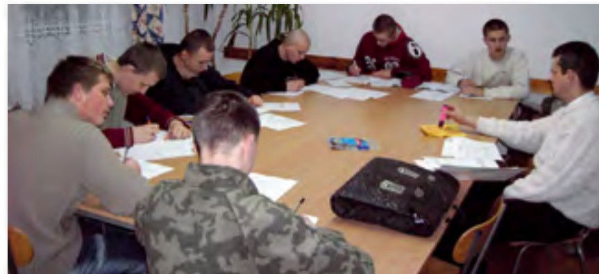
Enseñanza en grupo ▲

En la actualidad es a este tercer cometido al que preferentemente van dedicados los esfuerzos de la fraternidad pues la casa está constituida en la ciudad de Lublín como Centro de Día . Al mismo acuden diariamente 25 jóvenes, de entre 14 y 18 años en situación de alto riesgo, enviados por el juzgado. En el centro reciben clases de ocho de la mañana a ocho de la noche individualmente, y también en grupos, como se puede apreciar en la adjunta información gráfica.