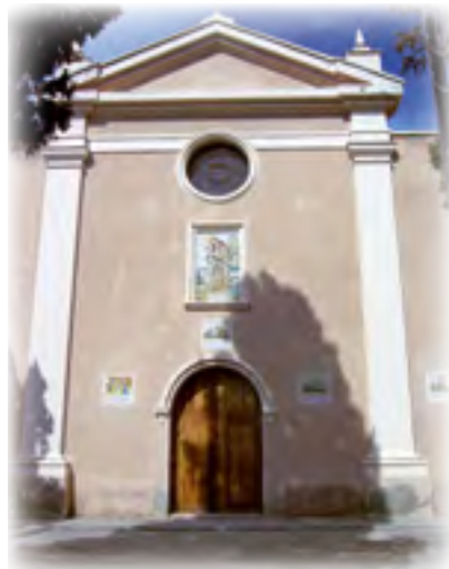
La Magdalena. Massamagrell ▲ Fachada de la iglesia

92. El otro hecho, también notable, fue que, hallándonos un día sin pan por efecto de un largo temporal