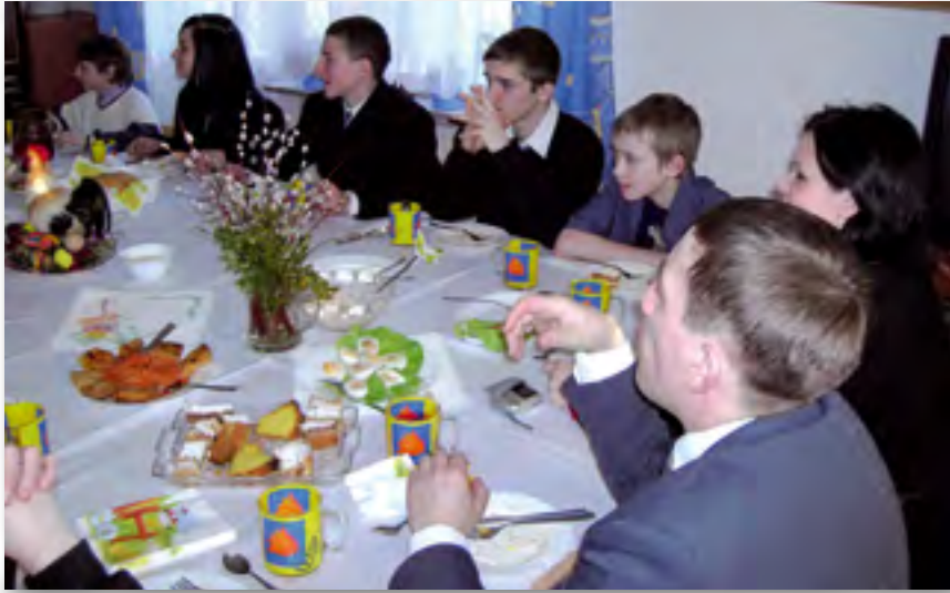
▲ Sal6n comedor

Como Centro de D6a la instituci6n camina muy bien, seg6n su director general, si bien todav6a falta un mayor trabajo a nivel de terapia familiar. Los juzgados que env6an a los j6venes est6n contentos con la labor que se realiza con los j6venes.