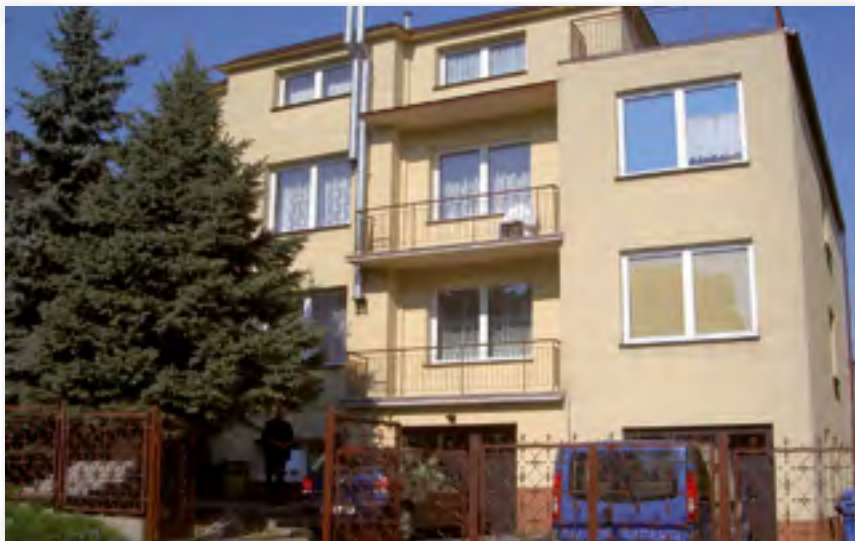
▲ Fachada de la institución