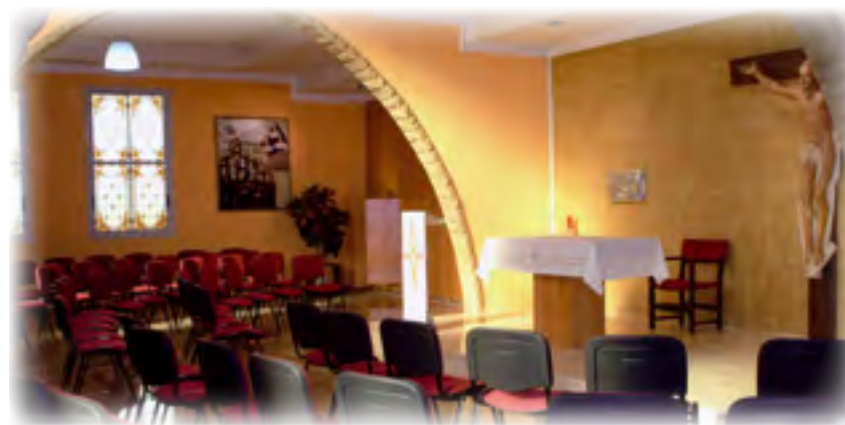
Montiel. Benaguacil. Capilla interior ▲

97. A estas pruebas y tribulaciones siguió para mí otra no menor. El Rvdmo. Padre Provincial Joaquín de Llanerres juzgando, sin duda, ser mejor para las religiosas el que él