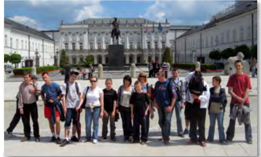
D6a de excursi6n ▲

El centro, propiedad de la Congregaci6n, tiene un contrato para cinco a6os con la ciudad, que subvenciona alrededor del 70% de los gastos de la instituci6n. La Provincia Luis Amig6 , as6 como la Fundaci6n Amig6 y el aporte del director general del centro completan el resto.