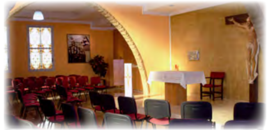
Montiel. Benaguacil. Capilla interior ▲

97. A estas pruebas y tribulaciones siguió para mí otra no menor. El Rvdmo. Padre Provincial Joaquín de Llanaveres juzgando, sin duda, ser mejor para las religiosas el que él