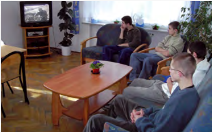
▲ Sal6n de recreo

Como Centro de D6a la instituci6n camina muy bien, seg6n su director general, si bien todav6a falta un mayor trabajo a nivel de terapia familiar. Los juzgados que env6an a los j6venes est6n contentos con la labor que se realiza con los j6venes.