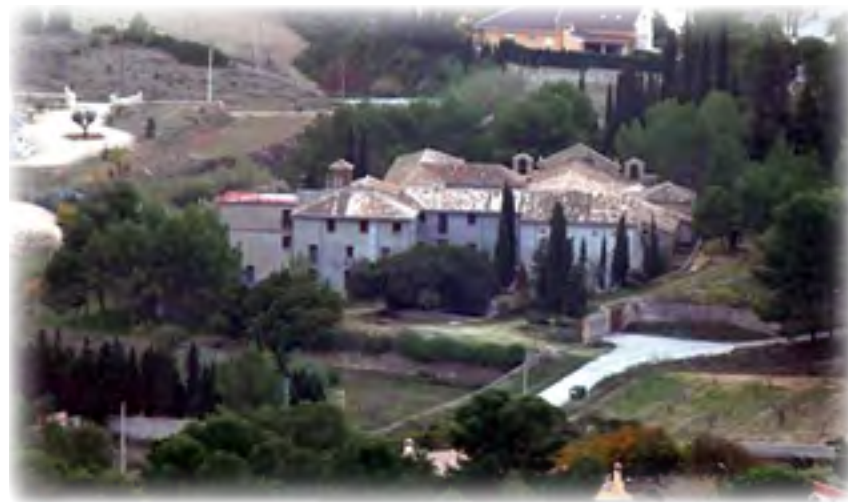
Convento capuchino de L'Olleria (Valencia) ▲

94. Dueños, pues, ya del convento empezamos en seguida las obras de reparación, en las que mucho me ayudó el pueblo, y duraron ellas más de tres meses, estando yo todo este tiempo al frente de las obras. Quie-